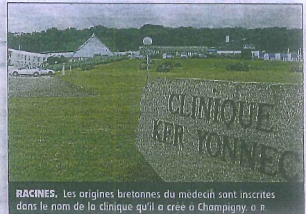
RACINES. Les origines bretonnes du médecin sont inscrites dans le nom de la clinique qu'il a créée à Champigny. O. R.

SANTÉ ■ Cofondateur de la clinique psychiatrique Ker Yonnec, à Champigny (Sénonais)