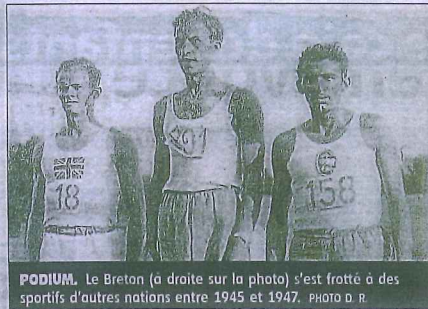
PODIUM. Le Breton (à droite sur la photo) s'est frotté à des sportifs d'autres nations entre 1945 et 1947.